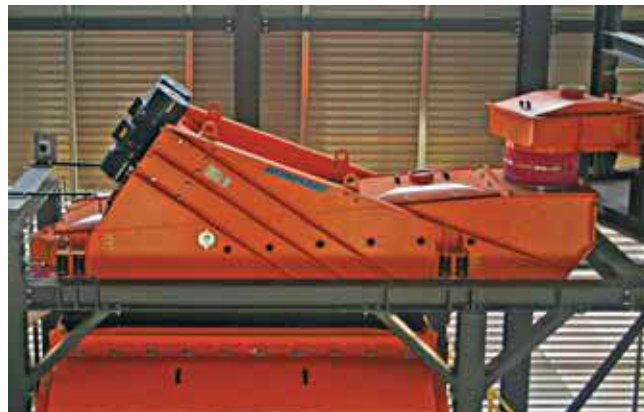
6 Питатель с поперечным распределением с интегрированным управляющим ситом