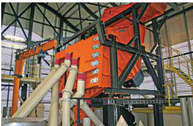
7 Установка Mogensen Sizer с питателем-распределителем в смесительной башне