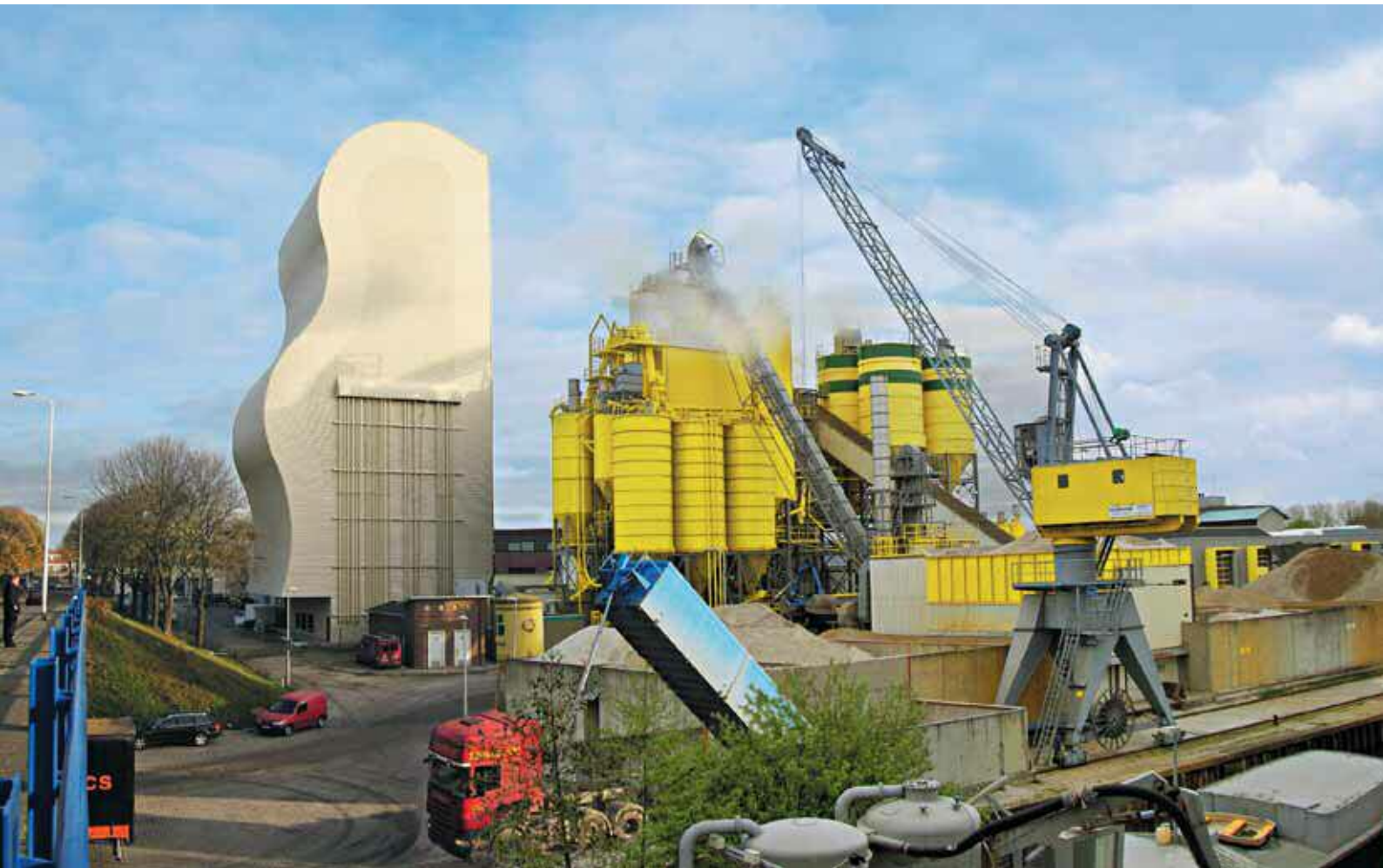
1 Смесительная башня MAXIMA (Вид 1)