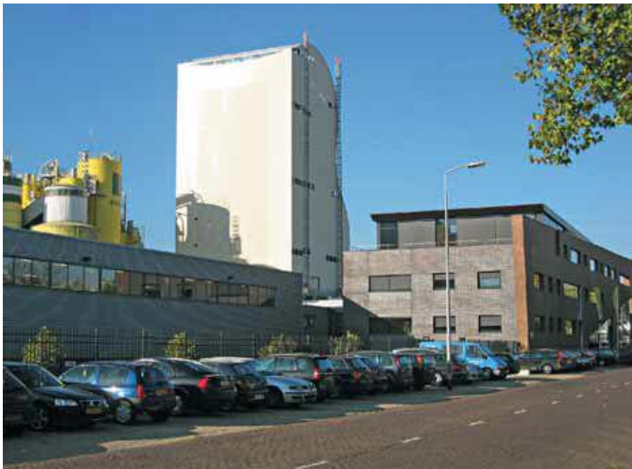
2 Смесительная башня MAXIMA (Вид 2)