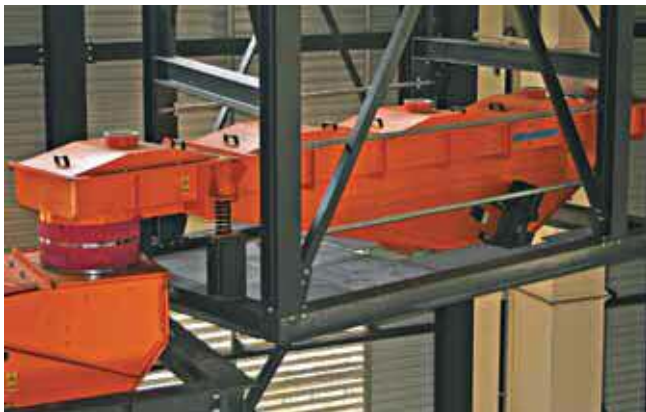
5 Виброконвейер ВВ 0655 между подъемником и поперечным питателем