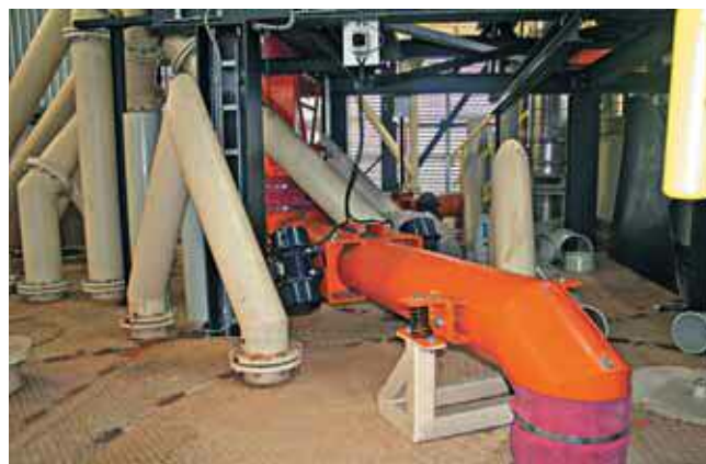
8 Трубчатый виброконвейер Mogensen

и транспортируются вниз по трубам на вход силоса. Тонкие фракции разгружаются под грохотом, фракции менее 0,5 мм выводятся горизонтально по четырехметровому трубчатому виброконвейеру (рис. 8).