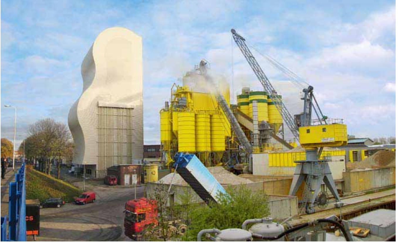
1 The MAXIMA mixing tower (View 1) • Der Mixing-Tower „MAXIMA“ (Ansicht 1)