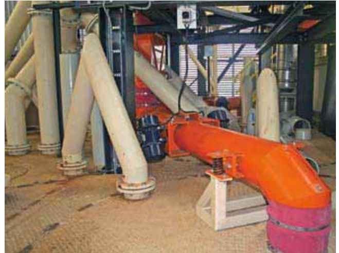
8 Mogensen vibrating tubular conveyor Mogensen Rohrschwingrinne

The special geometry of the discharge outlet in the base of the trough ensures conveying and metered discharge of the material stream for its uniform distribution of the width of the screen