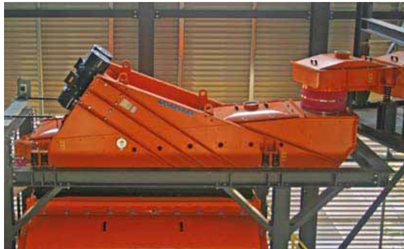
6 Transverse spreader feeder with integrated control screen Querverteiler mit integriertem Kontrollsieb

With conventional screen systems, the necessary availability of the numerous screened fractions would demand a large number of differently equipped screens or repeated refitting of the machines with suitable screening meshes. On account of the formation of material beds on the screening surfaces and the associated long residence times of the feed material in the machines, such a plant would be very bulky and very complex with regard to the machines needed. Conveying, metering and distributing equipment and the necessary support structure would represent a considerable additional cost factor.