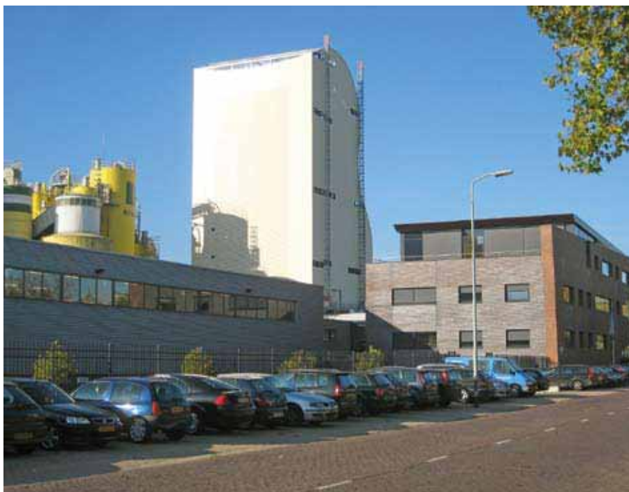
2 The MAXIMA mixing tower (View 2) Der Mixing-Tower „MAXIMA“ (Ansicht 2)