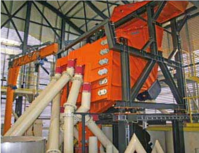
7 Mogensen Sizer with spreader feeder in the mixing tower Mogensen Sizer mit Verteilrinne im Mischturm

It was therefore necessary to design a screening system that consists of a single screen despite the large number of product grades to be cut. For this task, the Mogensen Sizer is particularly suitable.