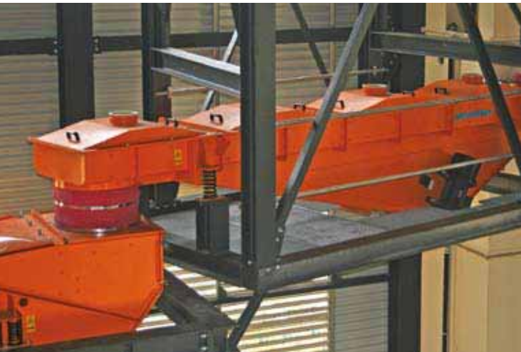
5 Conveyor trough between elevator and transverse spreader Förderrinne zwischen Elevator und Querverteiler

engineering high-quality machines for multi-sizing a wide range of bulk solids according to its Sizer principle. This patented principle is based on the research findings of the Swedish scientist and entrepreneur Fredrik Mogensen. He scientifically proved that multi-deck screens with screening decks arranged above one another at increasingly steep slopes from the top to the bottom (Fig. 3) demonstrate considerable advantages in respect of throughput rate, number of possible cuts, space and energy requirement as well as operating reliability and flexibility in application.